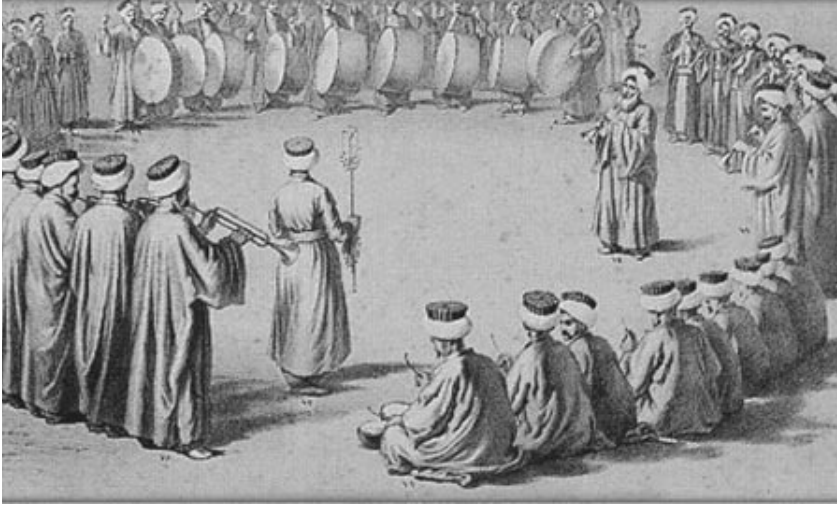
Osmanlı zamanında Mehter Takımı halka halinde toplanarak gösteri yapardı.

Sene 1956, yedek subaylık vazifemin son haftası, terhis zamanım. Gelibolu, Dumantepe, 40. piyade alayı, 3. birlik. Komutanlığına devretmem yakın. 1. Ordu Komutanı rahmetli General Ragıp Gümüşpala emri ile yeni kurulan ilk Askeri Mehter Takımı'nı İstanbul'a sevk vazifesi bana verildi. Alay karargahında bana verilen bu şerefli vazifeyi, heyecan ve mutluluktan titreyerek dinledim. Bunun daha evvel deruhte ettiğim merasim bölüğü komutanlığından daha mes'uliyetli bir vazife olacağından emindim.